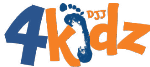
Discipleship Journeys with Jesus for Kids